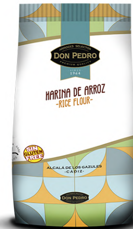
HARINA ARROZ DON PEDRO 400 g EAN: 8420933002728 UNIDADES/ CAJA: 14 CAJAS/PALET 84