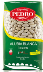
Alubia Blanca Pedro 500 g Codigo EAN 8420933000311 Unidades/ Caja: 20 Caja/ palet: 70