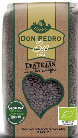
LENTEJA BIO DON PEDRO 500 g Codigo EAN: 8420933002261 Unidades/caja: 14 cajas/palet: 84