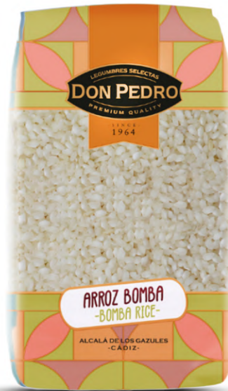
ARROZ BOMBA DON PEDRO 1 KG EAN: 8420933002834 UNIDADES/ CAJA: 20 CAJAS/PALET 42