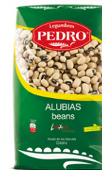
Alubia Carilla Pedro 500 g Codigo EAN 8420933000564 Unidades/ Caja: 20 Caja/ palet: 70