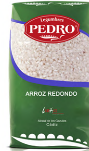
Arroz Corto Pedro 1 Kg Código EAN: 8420933000502 Unidades/ Caja: 20 Caja/ palet: 42