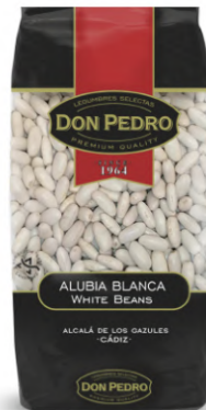
ALUBIA BLANCA 1 Kg Código EAN: 8420933001219 Unidades/ Caja: 20 Cajas/ palet: 42