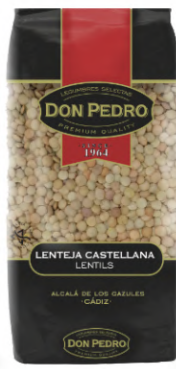
LENTEJA CASTELLANA 1 Kg Código EAN: 8420933001226 Unidades/ Caja: 20 Cajas/ palet: 42