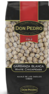
GARBANZA 500 g Código EAN: 8420933001110 Unidades/ Caja: 20 Cajas/ palet: 70