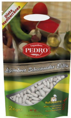
Alubia Blanca 2 Kg Doypack Codigo EAN: 8420933001455 Unidades/ Caja: 6 Caja/ palet: 55