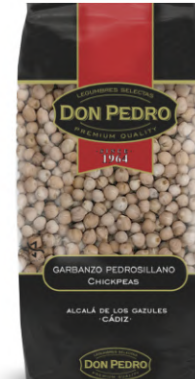
GARBANZO PEDROSILLANO 1 Kg Código EAN: 8420933001950 Unidades/ Cajas: 20 Cajas/ palet: 42