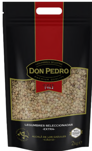
LENTEJA CASTELLANA 2 KG CÓDIGO EAN: 8420933002872 UNIDADES/ CAJA: 6 CAJAS/ PALET: 55