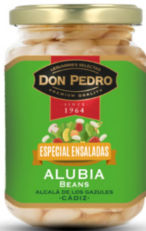
ALUBIA ESPECIAL ENSALADA 290 g Código EAN: 8420933002902 Unidades/ Caja: 12 Cajas/ palet: 140