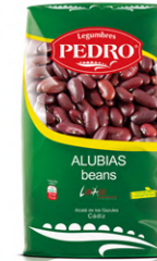
Alubia Roja Pedro 500 g Codigo EAN 8420933001059 Unidades/ Caja: 20 Caja/ palet: 70