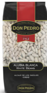
ALUBIA BLANCA 500g Código EAN: 8420933001998 Unidades/ Caja: 20 Cajas/ palet: 42