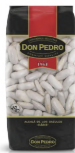
ALUBIA FABADA 500 g Código EAN: 842093300731 Unidades/ Caja: 20 Cajas/ palet: 70