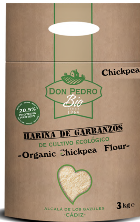
HARINA DE GARBANZO BIO DON PEDRO 3 KG Codigo EAN: 8420933002322