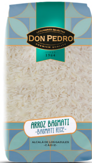
ARROZ BASMATI DON PEDRO 1 KG EAN: 8420933002810 UNIDADES/ CAJA: 20 CAJAS/PALET 42