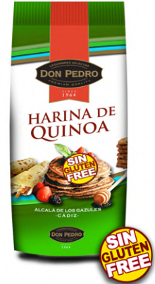
HARINA DE QUINOA 400 g Codigo EAN 8420933002162 Unidades/ Caja: 14 Caja/ palet: 84