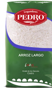
Arroz Largo Pedro 1 Kg Código EAN: 8420933001080 Unidades/ Caja: 20 Caja/ palet: 42