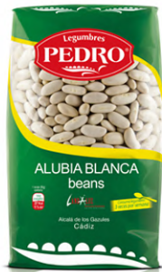
Alubia Blanca Pedro 1 Kg Codigo EAN 8420933000205 Unidades/ caja: 20 Caja/ palet: 42