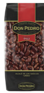
ALUBIA ROJA 500 g Código EAN: 8420933002445 Unidades/ Caja: 20 Cajas/ palet: 70