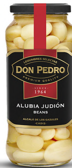
JUDIÓN COCIDO DON PEDRO Código EAN: 8420933001707 Unidades/Caja: 12 Cajas/palet: 84