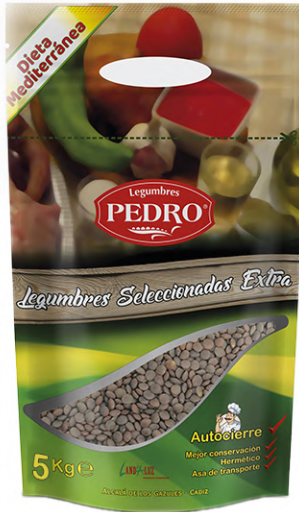
Lenteja Pardina 5 Kg Código EAN: 8420933000663