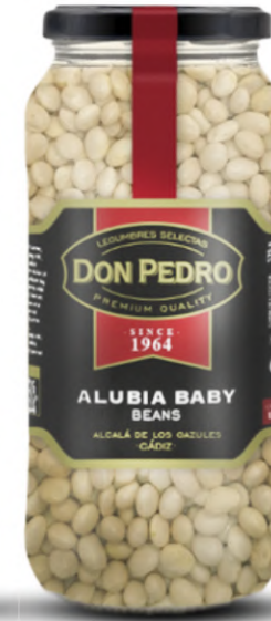
ALUBIA BABY COCIDA DON PEDRO Código EAN 8420933002216 Unidades/Caja: 12 Cajas/palet: 84