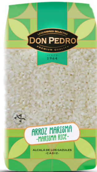
GAARROZ MARISMA DON PEDRO 1 KG EAN: 8420933002827 UNIDADES/ CAJA: 20 CAJAS/PALET 42