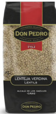
LENTEJA VERDINA 1 Kg EAN: 8420933002568 Unidades/ Caja: 40 Cajas/ palet: 42