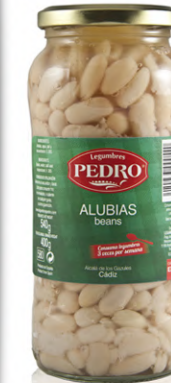
Alubias Cocidas 540 g Código EAN: 8420933000540 Unidades/Caja: 12 Cajas/ palet: 84