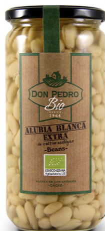
ALUBIAS COCIDAS BIO DON PEDRO 660 g Codigo EAN: 8420933002285 Unidades/caja : 12 cajas/palet: 70