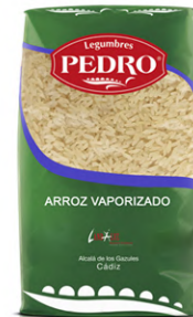
Arroz Vaporizado Pedro 1 Kg Código EAN: 8420933000588 Unidades/ Caja: 20 Caja/ palet: 42