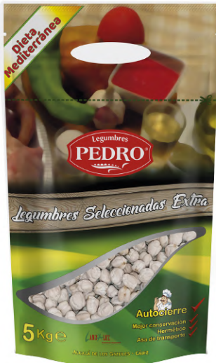
Garbanzo Lechoso 5 Kg Código EAN 8420933000649