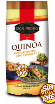
QUINOA DON PEDRO 500 g Codigo EAN 8420933002155 Unidades/ Caja: 14 Caja/ palet: 84