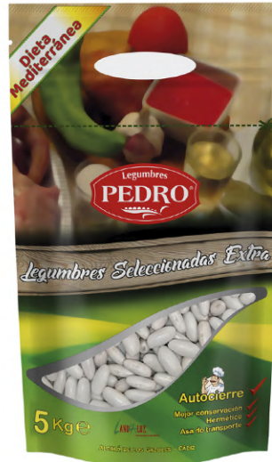
Alubia Blanca Pedro 5Kg Código EAN: 8420933000847