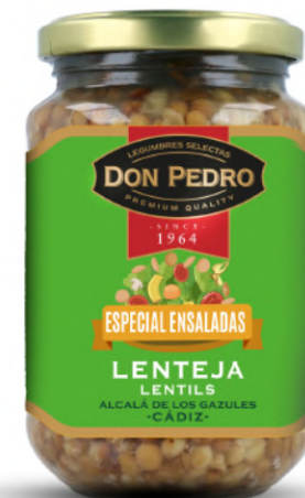
LENTEJA ESPECIAL ENSALADA 290 g Código EAN: 8420933002919 Unidades/ Caja: 12 Cajas/ palet: 140