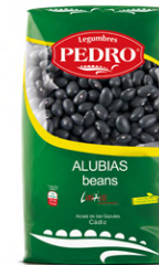
Alubia Negra Pedro 500 g Codigo EAN 8420933001073 Unidades/ Caja: 20 Caja/ palet: 70