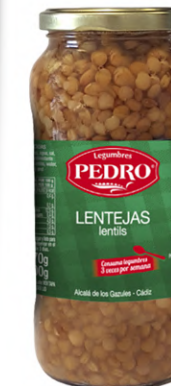
Lenteja Cocida 540 g Codigo Ean: 8420933000557 Unidades Caja: 12 Cajas/palet: 84