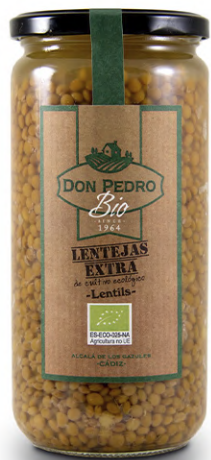
LENTEJAS COCIDAS BIO DON PEDRO 700 g Codigo EAN: 8420933002292 Unidades/caja : 12 cajas/palet: 70