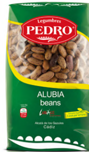
Alubia Pinta Pedro 1 Kg Codigo EAN 8420933000571 Unidades/ agrupacion: 20 Agrupacion/ palet: 42