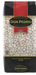
ALUBIA BABY 500 g Código EAN: 8420933002209 Unidades/ Agrupación: 20 Agrupación/ palet: 70