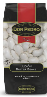
JUDIÓN 500 g Código EAN: 8420933002124 Unidades/ Agrupación: 20 Agrupación/ palet: 70