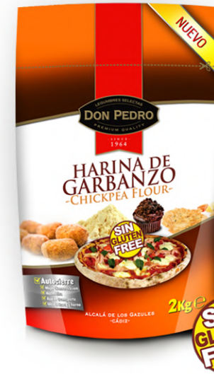
HARINA DE GARBANZO 2Kg Codigo EAN: 8420933002131 Unidades/ Caja: 6 Cajas/palet: 55