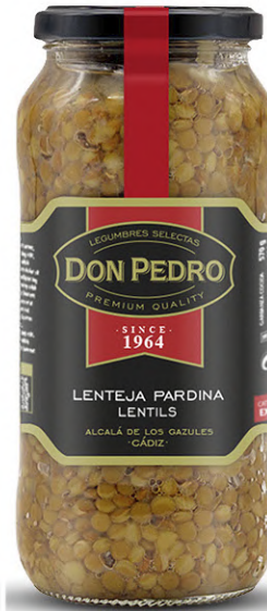
LENTEJAS COCIDAS DON PEDRO Código EAN: 8420933001974 Unidades/Caja: 12 Cajas/palet: 84