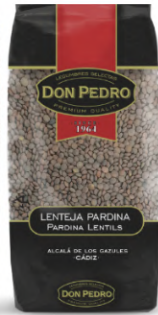
LENTEJA PARDINA 500g Código EAN: 8420933002018 Unidades/ Caja: 20 Cajas/ palet: 70