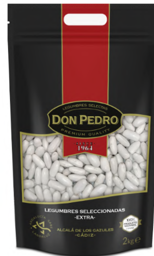
ALUBIA BLANCA DOYPACK 2 KG CÓDIGO EAN: 8420933002797 UNIDADES/ CAJA: 6 CAJAS/ PALET: 55