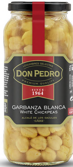
GARBANZA COCIDA DON PEDRO Código EAN: 8420933001677 Unidades/Caja: 12 Cajas/palet: 84