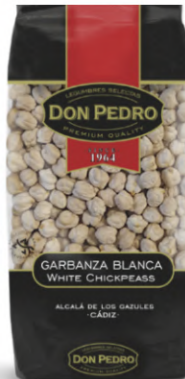
GARBANZA 1 Kg Código EAN: 8420933001141 Unidades/ Cajas: 20 Cajas/ palet: 42