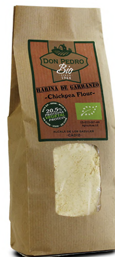
HARINA DE GARBANZO BIO DON PEDRO 400 g Codigo EAN: 8420933002490 Unidades/caja : 14 cajas/palet: 84