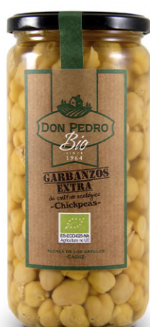
GARBANZOS COCIDOS BIO DON PEDRO 700 g Codigo EAN: 8420933002278 Unidades/caja : 12 cajas/palet: 70