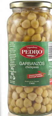
Garbanzos Cocidos 540 g Código EAN 8420933000533 Unidades/Caja: 12 Cajas/ palet: 84