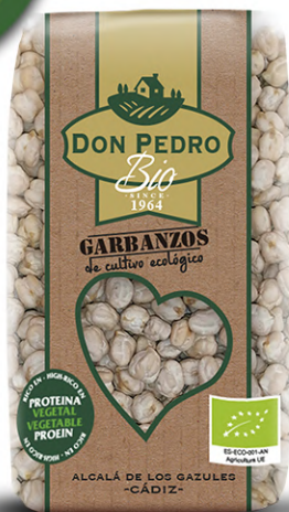
GARBANZO BIO DON PEDRO 500 g Codigo EAN: 8420933002230 Unidades/caja: 14 cajas/palet: 84