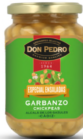
GARBANZO ESPECIAL ENSALADA 290 g Código EAN: 8420933002896 Unidades/ Caja: 12 Cajas/ palet: 140