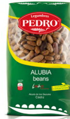
Alubia Pinta Pedro 500 g Codigo EAN 8420933000526 Unidades/ Caja: 20 Caja/ palet: 70