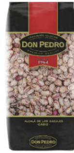
ALUBIA PINTA 500 g Código EAN: 8420933002377 Unidades/ Caja: 20 Cajas/ palet: 70