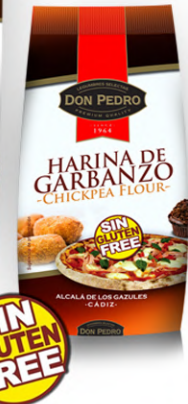
HARINA DE GARBANZO 400 g Codigo EAN: 8420933002025 Unidades/ Caja: 14 Caja/ palet: 84