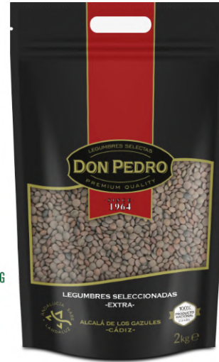
LENTEJA PARDINA DOYPACK 2 KG CÓDIGO EAN: 8420933002803 UNIDADES/ CAJA: 6 CAJAS/ PALET: 55