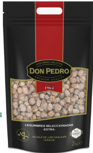
GARBANZA BLANCA DOYPACK 2 KG CÓDIGO EAN: 8420933002780 UNIDADES/ CAJA: 6 CAJAS/ PALET: 55