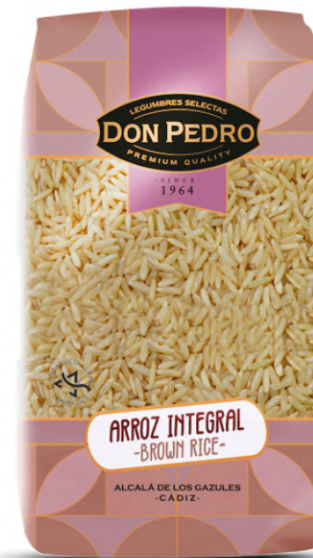
ARROZ INTEGRAL DON PEDRO 1 KG EAN: 8420933002841 UNIDADES/ CAJA: 20 CAJAS/PALET 42