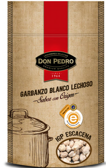
GARBANZO IGP ESCACENA DON PEDRO 700 g CÓDIGO EAN: 8420933002315 UNIDADES/ CAJA: 8 CAJAS/PALET: 84