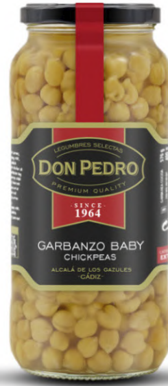
GARBANZO BABY DON PEDRO 540 g Codigo EAN: 8420933002308 Unidades/Caja: 12 Cajas/palet: 84