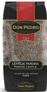
LENTEJA PARDINA 1 Kg Código EAN: 8420933001967 Unidades/ Caja: 20 Cajas/ palet: 42